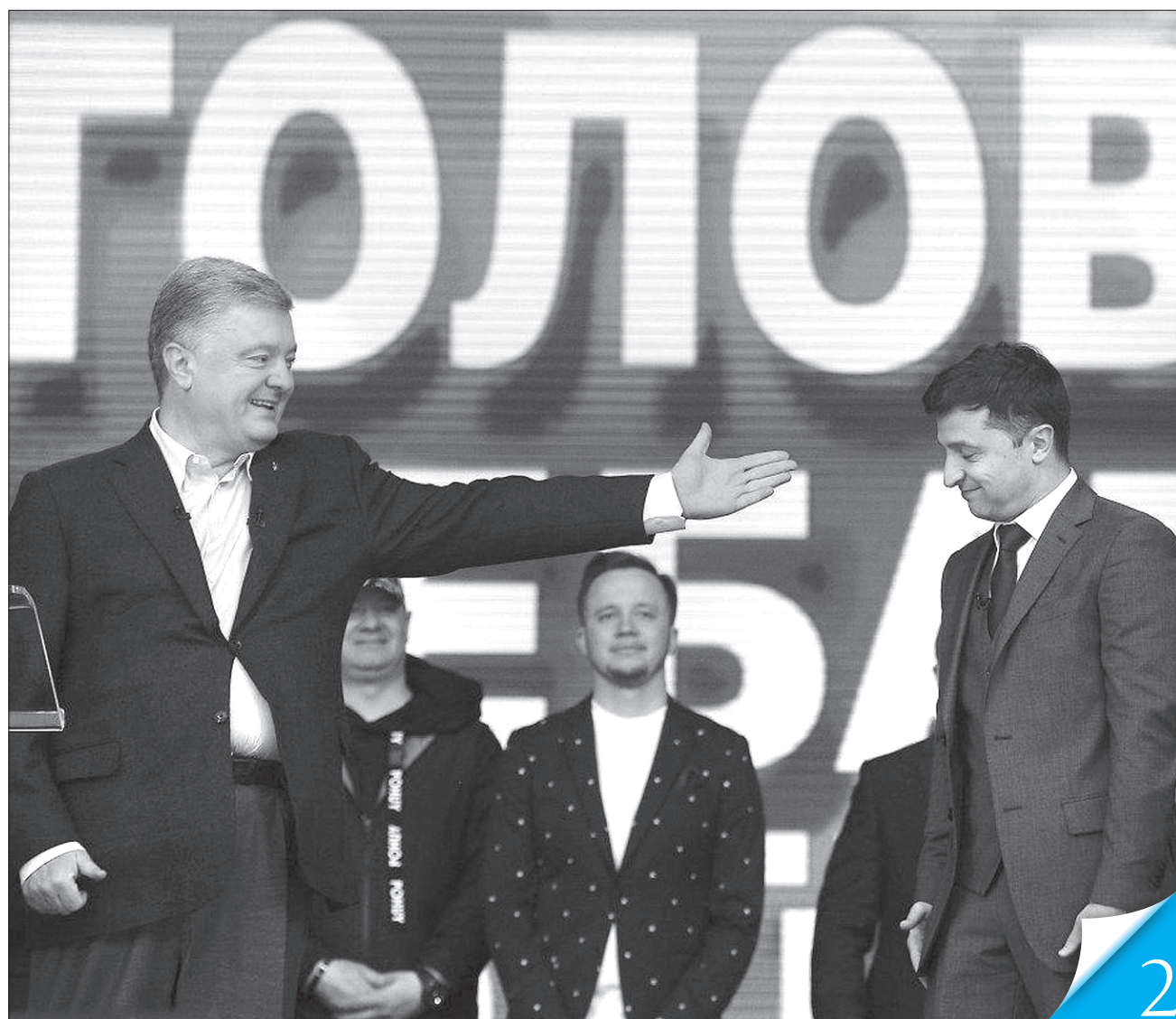
Вільні вибори й мирна зміна влади дорівнюють міцній українській демократії