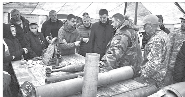
Експонати виставки зразків боєприпасів, які використовують у зоні проведення АТО, викликали жвавий інтерес