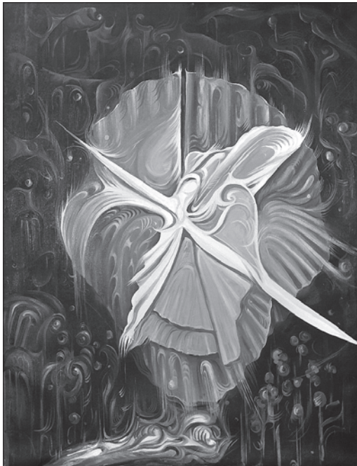
Ирій. Світове дерево