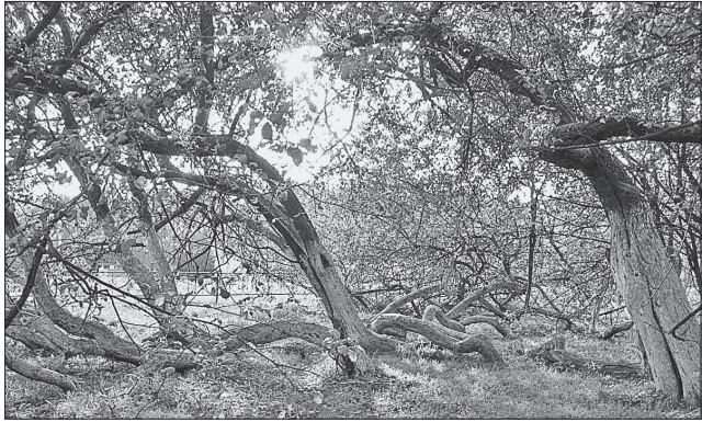
Яблуня-колонія у Кролевеці — диво, подібного якому немає у світі

«СУМСЬКИЙ ЛУВР». Любите образотворче й декоративне мистецтво? Тоді вам слід побувати в Сумському обласному художньому музеї імені Никанора Онацького, якому в 2020-му виповниться 100 років. Завдяки йому ви зможете долучитися до світу прекрасного, який втілено в картинах художників зі світовими іменами. А вже недарма сумчани називають цей культурний заклад другим Лувром. Його колекцію картин вважають однією з найкращих в Україні. В її основі — зібрання видатного підприємця і колекціонера Оскара Гансена. Вона налічує понад 15 тисяч експонатів вітчизняного і закордонного образотворчого й декоративного мистецтва XVI—XXI ст. В основній