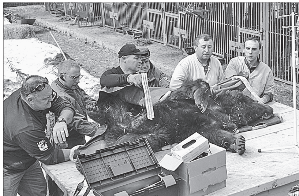
Ветеринари дбають про здоров'я тварин, якими вони опікуються

Утримують центр реабілітації бурих ведмедів, яких тут кілька десятків (а в дикій природі в Україні близько 300), державним коштом.