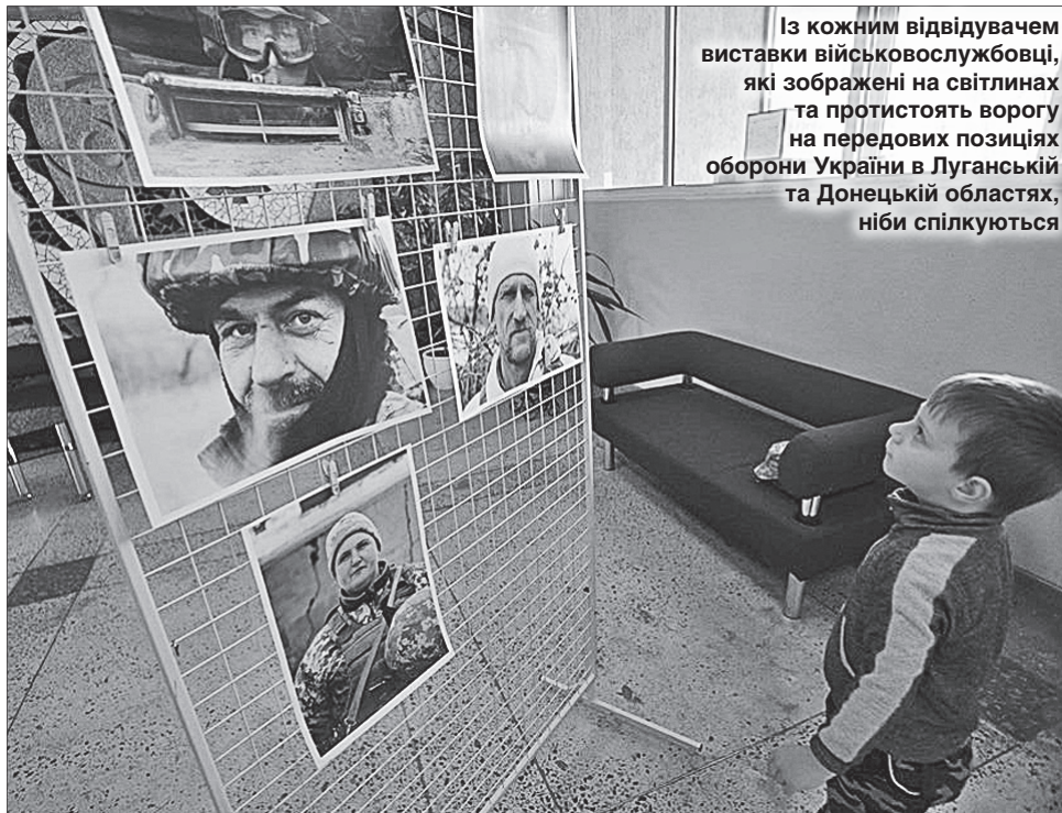
Із кожним відвідувачем виставки військовослужбовці, які зображені на світлинах та протистоять ворогу на передових позиціях оборони України в Луганській та Донецькій областях, ніби спілкуються

За словами автора, він прагнув показати справжні, людяні обличчя захисників. Це своєрідна відповідь на ворожу інформаційну пропаганду, що зображає українських військовослужбовців карателями. «Ми ведемо війну, але тільки захищаємо свою країну. Ми не злі, у нас нема історичної агресії. Хочу, щоб усі побачили, що захисники Укра-