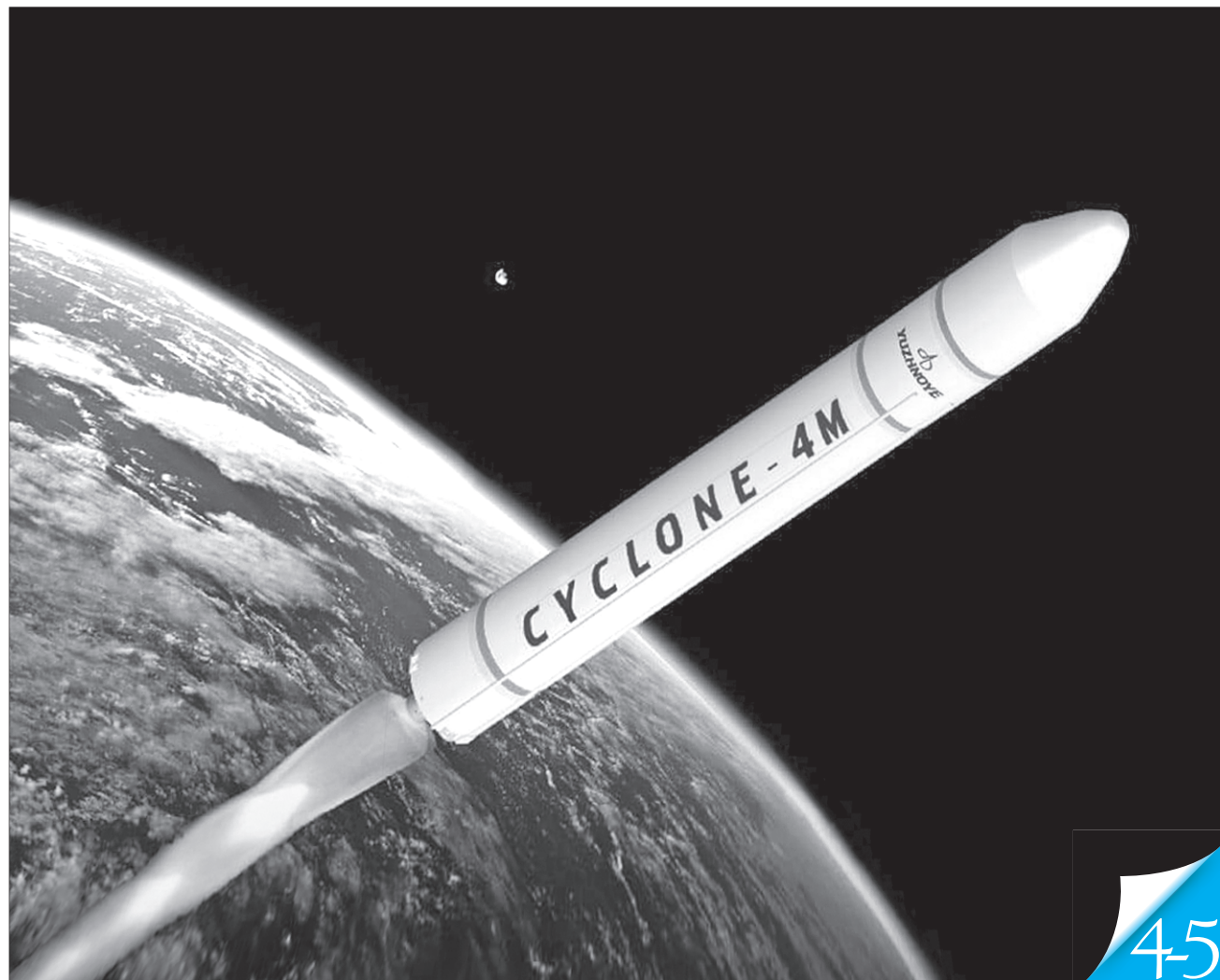
Ілюстрація з сайту spaceq.ca