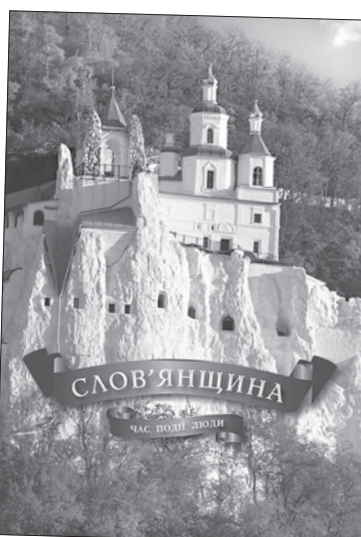
Такий вигляд має нове видання про Слов'янський район Донецчини

Торських озерах і заснували Святогірський монастир після взяття Києва монголо-татарами у 1240 році. Безперечно, зацікавлять читачів матеріали полеміки багатьох дослідників, які вже більш як два століття з'ясовують точне місце битви князя Новгород-Сіверського Ігоря Святославовича з половцями, що у 1185 році відбулася в тутешніх місцях. Чимало архівних документів зібрано про минулі епохи та відомих людей, життя і діяльність яких пов'язано зі Слов'янщиною: Михайло Петренко, Іван Манжура, Григорій Данилевський чи актор Леонід Биков. «Хто ми? Звідки? Відповіді на ці питання шукаємо повсяк-