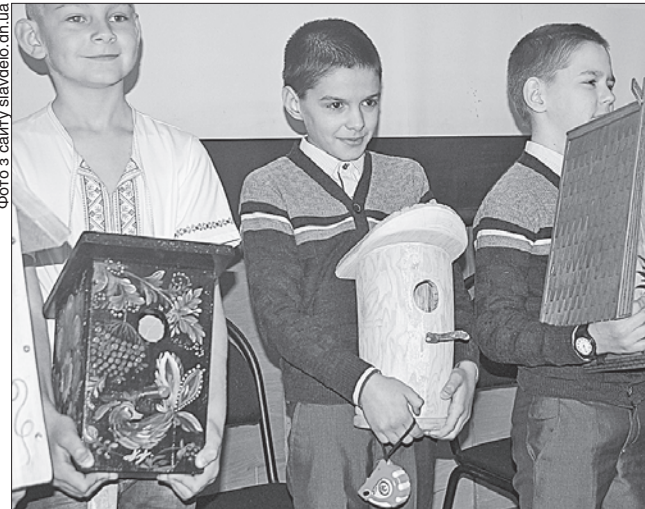
У школярів Слов'янська шпаківні вийшли дуже креативними

НОВОСІЛЛЯ ПТАХІВ. У Слов'янську в комунальному закладі «Центр культури і довілля» відбувся традиційний п'ятий фестиваль шпаківень «Шпак-House», приурочений до Міжнародного дня птахів. У цікавому й корисному заході взяли участь учні з восьми міських шкіл, які попередньо власноруч виготовляли шпаківні. Діти дуже креативно підійшли до справи, а тому своєрідний парад дерев'яних палаців закономірно став однією з цікавинок фестивалю. А ще учасники спільними зусиллями підготували пізна-