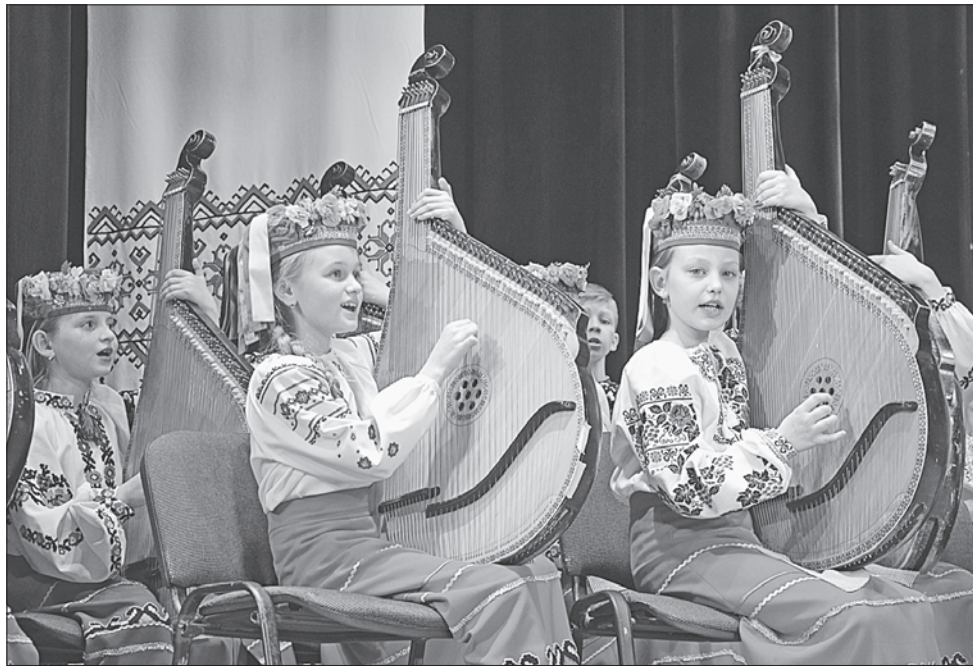
Грають і співають маленькі бандуристки з міста Заліщики