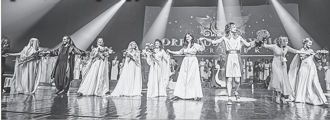
Авторів і учасників вистави надихає успіх в опері Дубая

Микола ПЕТРУШЕНКО для «Урядового кур'єра»