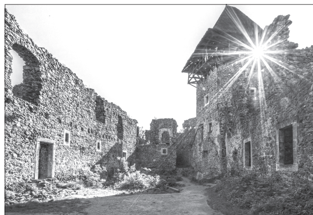
Невицький замок на Закарпатті залишиться привабливим для туристів

туристичного об'єкта. Виконуватиме роботи, які мають завершити до кінця 2020 року, спеціалізована будівельна організація «Західреставрація», що квартирує у Львові.