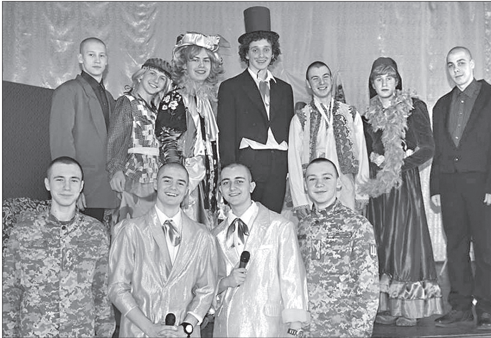
Ці хлопці впоралися зі складним завданням

Присутні дізналися про історію виникнення українського театру, його розвиток, видатних діячів театрального життя, повідомляє обласний департамент освіти і науки. Ознайомилися із правилами поведінки в театрі в ігровій формі та віртуально відвідали найвідоміші театри світу.