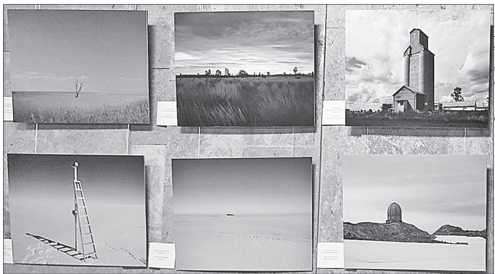
Дивовижні ландшафти двох континентів вражають

Для багатьох українців та й загалом європейців Австралія залишається далеким мало-відомим континентом. Тож цією виставкою дипломати прагнуть наблизити її, зробити зрозумілішою. Художникові вдалося майстерно поєднати в експозиції враження й настрої від двох континентів. Антарктида дивовижно красива, але безплідна земля, позбавлена життя. Фотографії ж Австралії показують живий пейзаж, який іноді здається неземним, як антарктична пустеля. А часом на знімках зупинено мить, що дає відчуття єдності світу, хоч би яким різним він видавався.