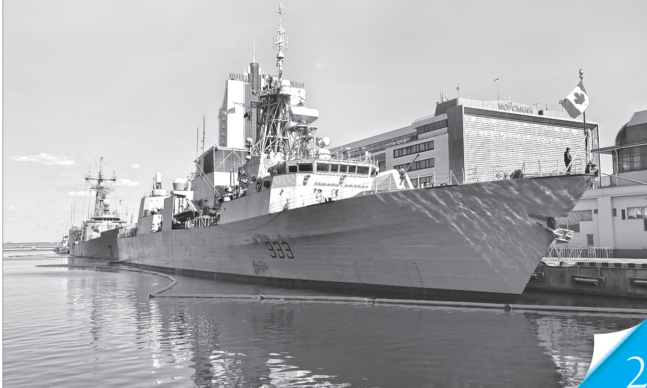
У Чорному морі з'являється дедалі більше військових кораблів Альянсу

ПАРТНЕРСТВО. Найуспішніший колективний договір минулого століття доводить актуальність і в сучасних умовах, коли постала реальна загроза зміни світового порядку через агресивні дії РФ проти України й усієї західної цивілізації