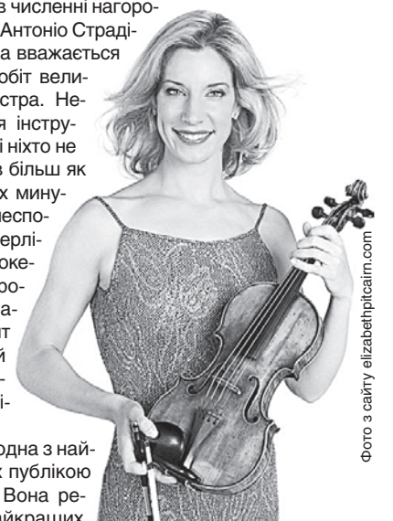
В Україну завітає одна з найвідоміших скрипальок Америки Елізабет Піткертн з найдосконалішою скрипкою Антоніо Страдіварі

Елізабет Піткертн — одна з найвідоміших і улюблених публікою скрипальок Америки. Вона регулярно виступає в найкращих концертних залах США, президент і художній керівник музичного центру Люцерн у штаті Нью-Йорк, де навчаються обдаровані молоді музиканти.