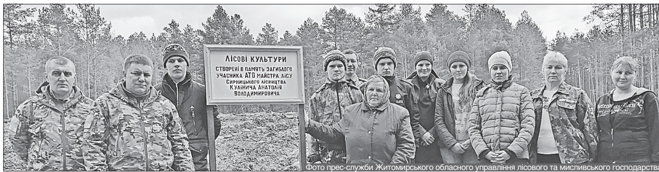
Ліс спонукає кожного небайдужого ставати кращим, а висаджений на пам'ять про загиблих героїв — особливо