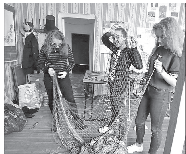
Під час весняних канікул старшокласники долучилися до допомоги бійцям

УСІ ДЛЯ ФРОНТУ! На Донеччині в Авдіївці волонтери розгорнули кілька пунктів, де до виготовлення маскувальних сіток для захисників міста долучилися школярі. За кошти благодійного фонду «Зорі надії» придбали деревину для каркаса та основу для сіток, а далі волонтери попросили про допомогу місцевих жителів, серед яких чимало молоді.