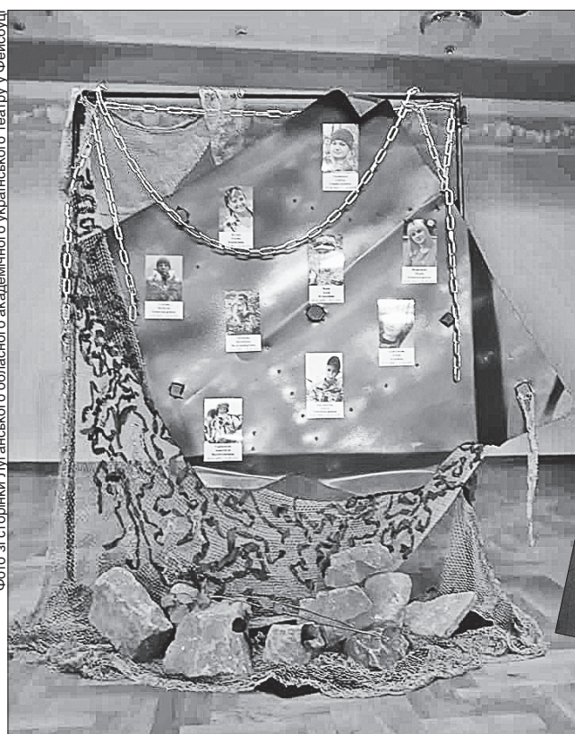
Нинішніх жінок-захисниць автори вистави порівняли з Жанною д'Арк, яка підняла народ проти окупантів