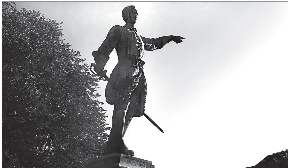
Історичну роль Івана Мазепи та його стосунки з російським царем Петром I у фільмі переосмислено

«Такі документальні роботи дуже важливі для віднов-