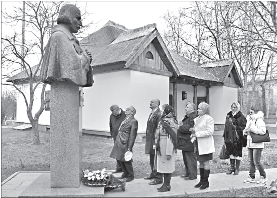
Микола Гоголь зустрічає гостей із Полтави в батьківській садибі