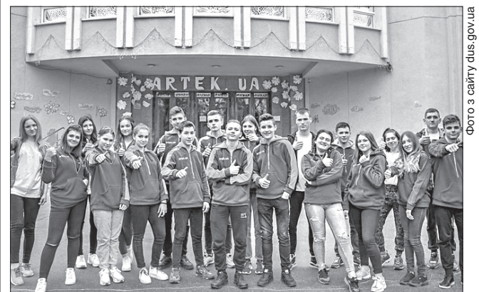
До 12 квітня у Міжнародному дитячому центрі «Артек» триває тематична зміна «Артек збирає друзів», учасниками якої стали понад 900 дітей з усієї України

Не нудьгуватимуть представники Донеччини й у Пущі-Водиці, де розпочалася тематична зміна «Артек» збирає друзів», під час якої різноманітні ігри поєднують із навчанням. Вони стануть учасниками всеукраїнського семінару трудової діяльності для дітей і підлітків, акції «Ангели-обереги», спрямованої на підтримку українських воїнів, які беруть участь в операції Об'єднаних сил на Донбасі, пізнавальних економічних ігор та змагань.