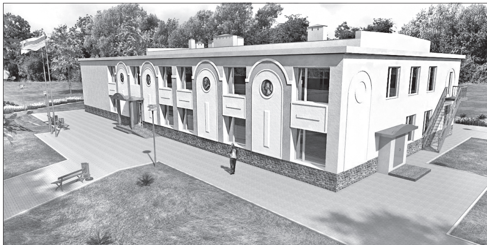
Будівля майбутнього центру дозвілля на вулиці Льва Вайнгорта в Гоголево