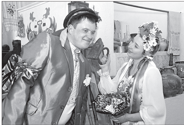
У Музеї народного весілля в селі Великі Будища Диканського району можна не лише доторкнутися до експонатів, а й перенестися в минуле

А в Сорочинцях можна побувати на театралізованій екскурсії «Вечера з Го-