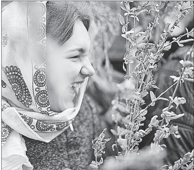
Вербна неділя готує нас до головного християнського свята Воскресіння Христового

Але якщо замість викопних ресурсів дедалі ширше використовують альтернативні джерела енергії, то обмежень у розробленні новітньої зброї поки що не існує. Тож стихійні лиха й апологети воєнної доктрини діють у тандемі. Цьогорічний березень запам'ятається ще кількома днями раптового потепління. Воно спричинило передчасне пробудження мурашок, метеликів і бджіл. Перший обліт крилаті трудівниці здійснили 9 березня. За спостереженням мого сусіда пасіч-