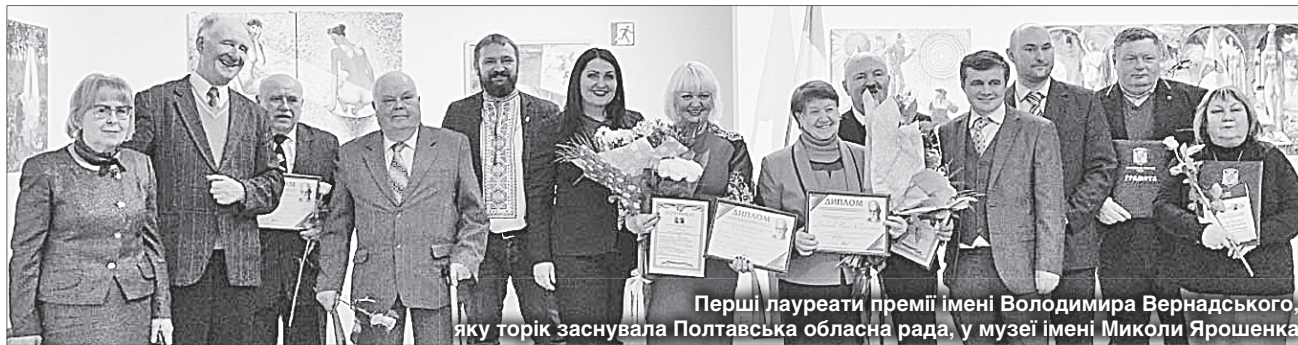
Перші лауреати премії імені Володимира Вернадського, яку торік заснувала Полтавська обласна рада, у музеї імені Миколи Ярошенка