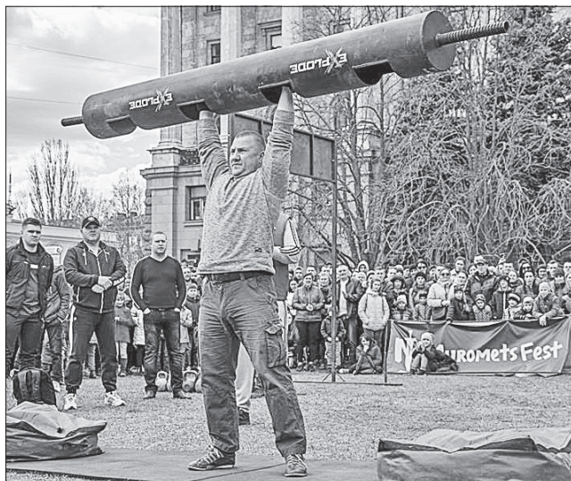
Свої вміння демонструють справжні богатири