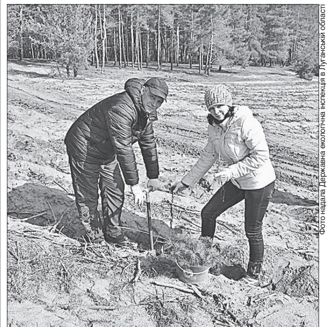
Робота виявилася радісною

ВЕСНЯНІ ТУРБОТИ. Працівники Державної екологічної інспекції в Луганській області спільно з ДП «Северодонецьке лісомисливське господарство» та учнями 7 класу ЗОШ №5 у Всесвітній день лісу посадили за містом саджанці сосни звичайної.