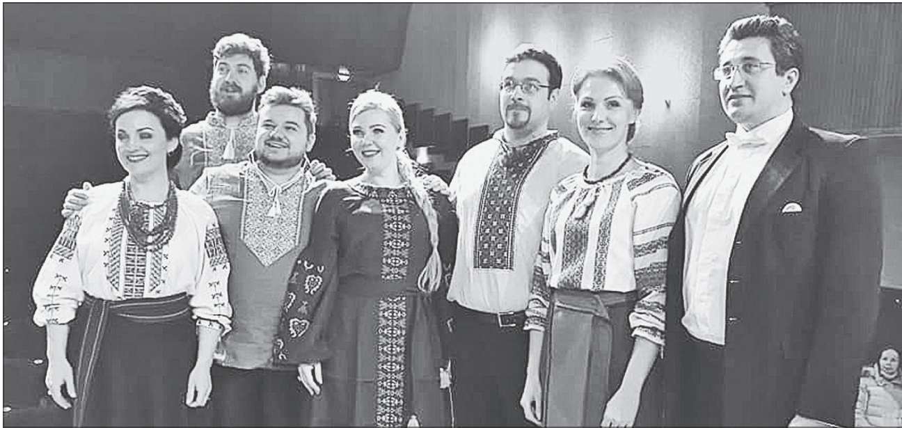
Музиканти і співаки з різних областей України з натхненням виконали оперу на Луганщині