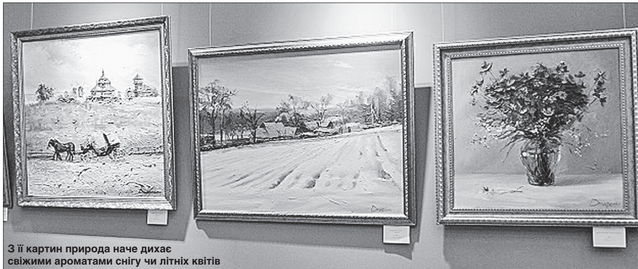
З її картин природа наче дихає свіжими ароматами снігу чи літніх квітів