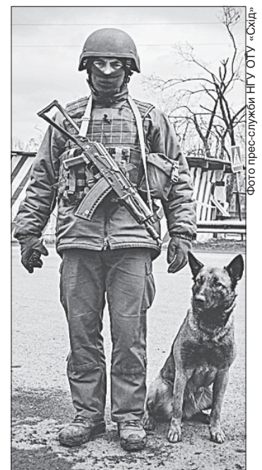
Кенді та її господар знову на посту

Як розказали у прес-службі НГУ ОТУ «Схід», недавно гвардійська Кенді продемонструвала унікальні здібності на мобільному блокпості біля населеного пункту Миколаївка Донецької області. У салоні одного з автомобілів вона виявила заховані автоматні та пістолетні набой. А свого часу вправна помічниця військослужбовців та її господар гвардієць-кінолог стали переможцями IV міжнародного змагання кінологічних команд «Україна-2018» у номінації «Пошук зброї та набой».