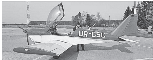
За допомогою цього літачка водна поліція контролюватиме нерестовища риби

вами її керівника Олега Стешенка, це дасть змогу бачити ситуацію на воді, рибалок-порушників, а також оперативно прийти на допомогу громадянам, які потрапили в біду.