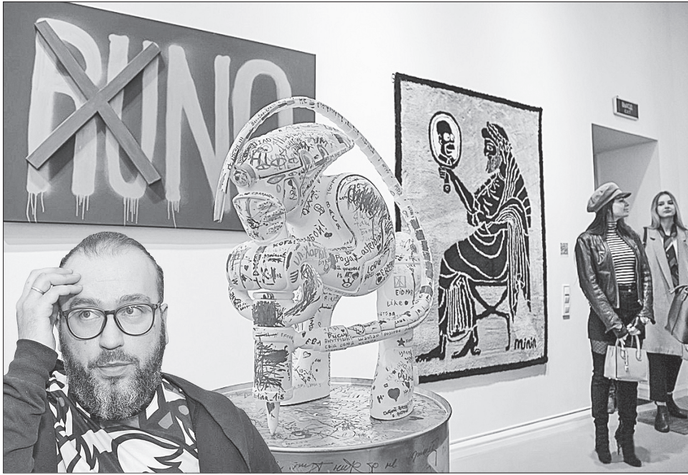
Виставка Романа Мініна яскрава і креативна

КУЛЬТУРА. У Харківській муніципальній галереї відкрилася третя частина проекту «Золото нації» популярного українського художника Романа Мініна.