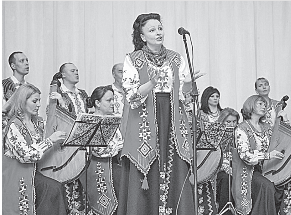
Вірші Тараса Шевченка чудово лягають на музику

У межах відзначення 205-ї річниці з дня народження Кобзаря та 20-річчя Центру шевченкознавчих досліджень літературознавці вишу презентували дослідження про Шев-