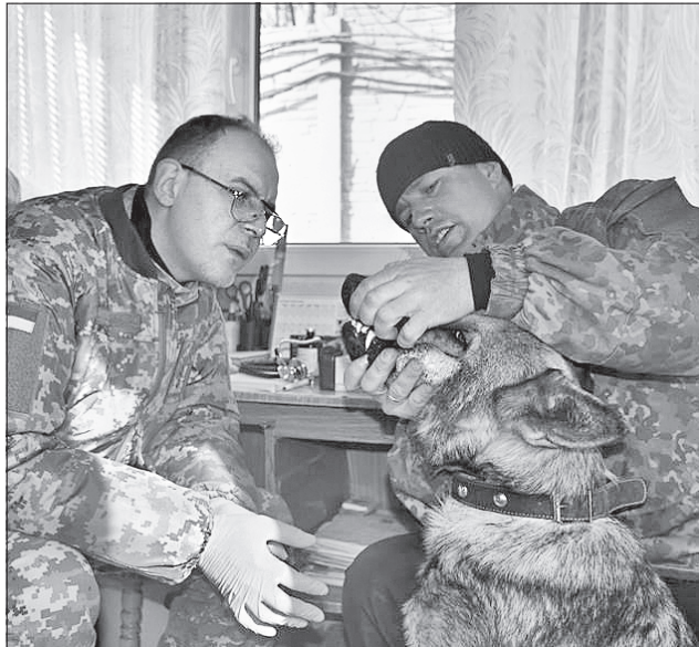
На Луганщину прибула мобільна ветеринарна бригада для надання медичної допомоги поліцейським службовим собакам

Як повідомляє відділ комунікації ГУ Нацполіції у Луганській області, тільки протягом минулого року в регіоні з допомогою службових собак з незаконного обігу вилучено більш як 1200 вибухових пристроїв, понад кілограм вибухових речовин та понад 22 тисячі набойів різного калібру.