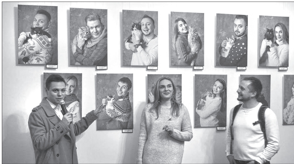
Котики дарують усім позитивні емоції

Недавно обласний художній музей уже традиційно у березні відкрив екологічно-мистецький проект «Хвіст-ART». У ньому кілька складових: художня виставка, фотопроєкт, майстер-класи. Головний герой виставки кіт — не просто давно знайома тварина, а істота, яка викликає безліч найрізноманітніших позитивних емоцій та асоціацій. Сприйняття кота багатогранне. Це дитяча колицьова і символ потаємних сил, уособлення витонченої грації й абсолютної хижості, втілення гламуру і вроджена відданість своєму призначенню, уособлення