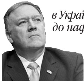
Держсекретар США про одну з причин агресії РФ проти нашої країни

«Ми знаємо, що Росія вторглася в Україну, щоб мати доступ до нафтогазових ресурсів. РФ використовує газопроводи для політичного тиску на Україну».