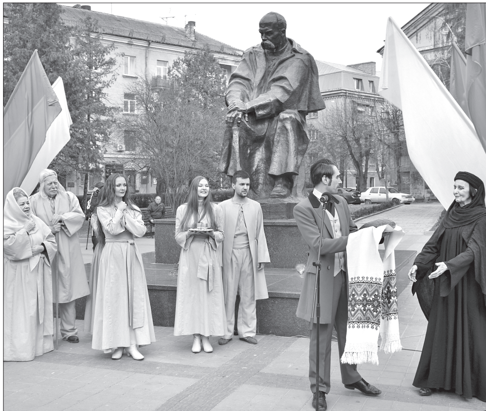
Біля пам'ятника Т. Шевченкові в Тернополі актори академічного драмтеатру зіграли сцену повернення Тараса в Україну після тривалих років російської солдатчини, заслання, поневірян

Пісні й вірші Кобзаря звучали і біля пам'ятника в Тернополі. Актори Тернопільського академічного драмтеатру, названого ім'ям великого поета, зіграли сцену повернення Тараса в Україну після тривалих років російської солдатчини, заслання, поневірян. У бага-