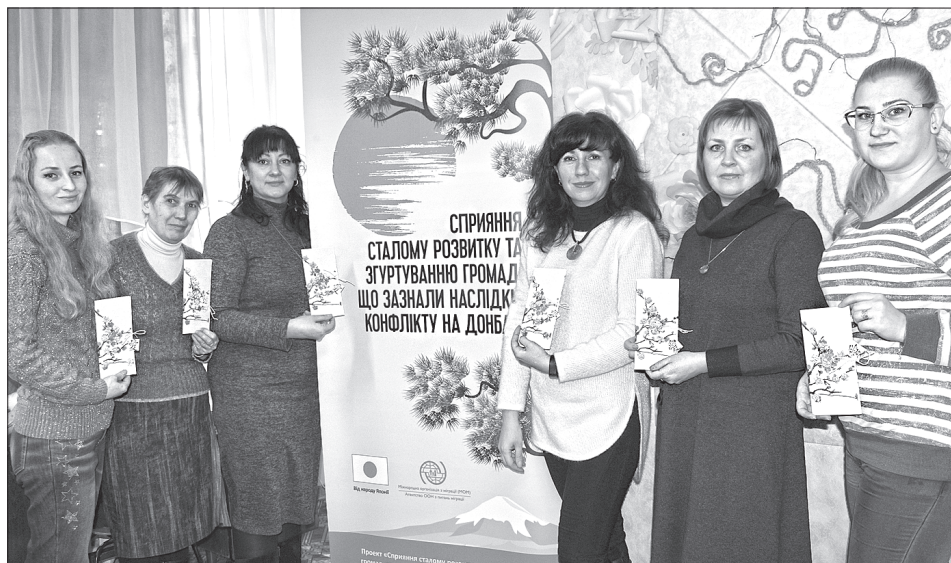
Северодонецький Центр еколого-натуралістичної творчості учнівської молоді провів арт-релакс

АРТ-РЕЛАКС. Учасниками семінару-практикуму «Арт-релакс: «Сакура на ваших долонях», який відбувся на базі Северодонецького міського центру еколого-натуралістичної творчості учнівської молоді, стали методисти, керівники гуртків, заступники директорів та культурні організатори закладів позашкільної освіти. За відгуками гостей, найбільше зацікавила практична частина семінару, в якій педагоги відвідали теплицю, де стали учасниками екологічного квесту. Було організовано майстер-клас із виготовлення японської шокладниці та оздоблення для неї — паперових квітів сакури. Японська чайна церемонія стала цікавим досвідом знайомства з культурою й традиціями народу Японії.