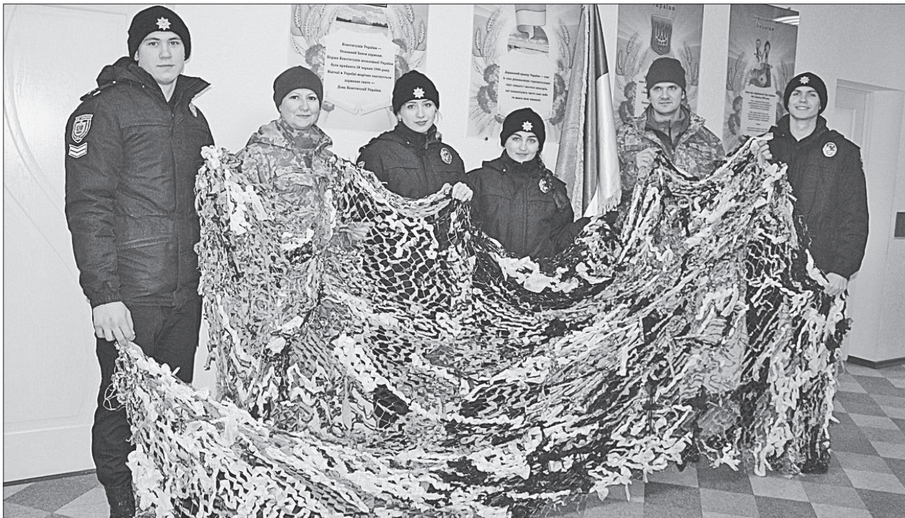
Майбутні поліцейські передали на передову маскувальні сітки