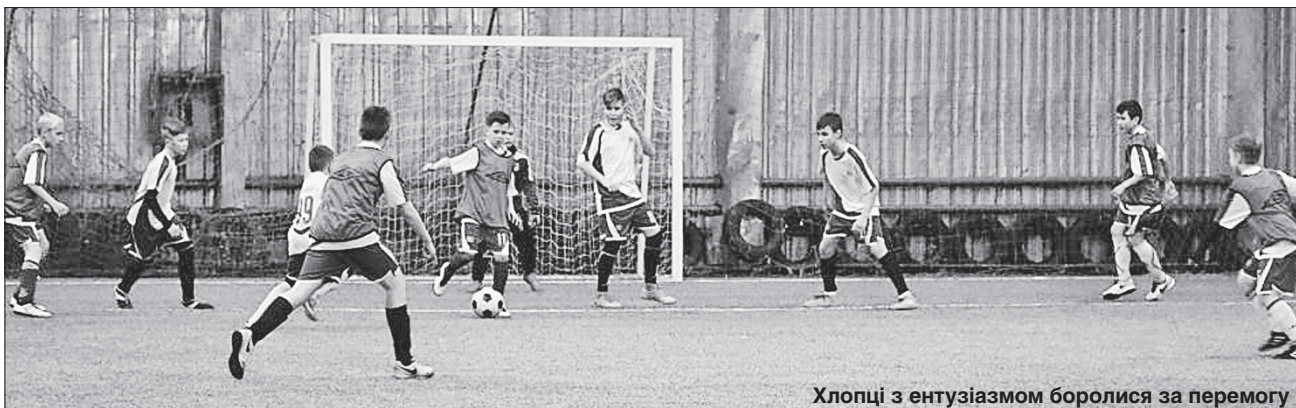
Хлопці з ентузіазмом боролися за перемогу