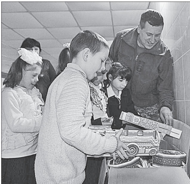
Іграшки, одяг і солодоці — то завжди в дітей найбільша цінність