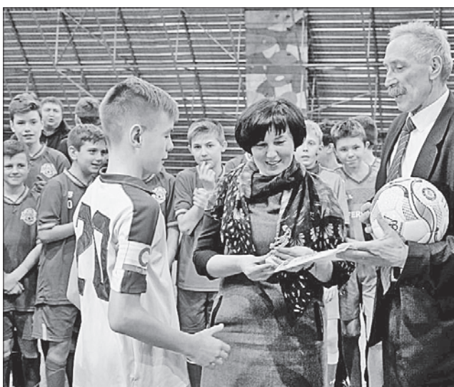
Найкращі юні футболісти отримали відзнаки і подарунки