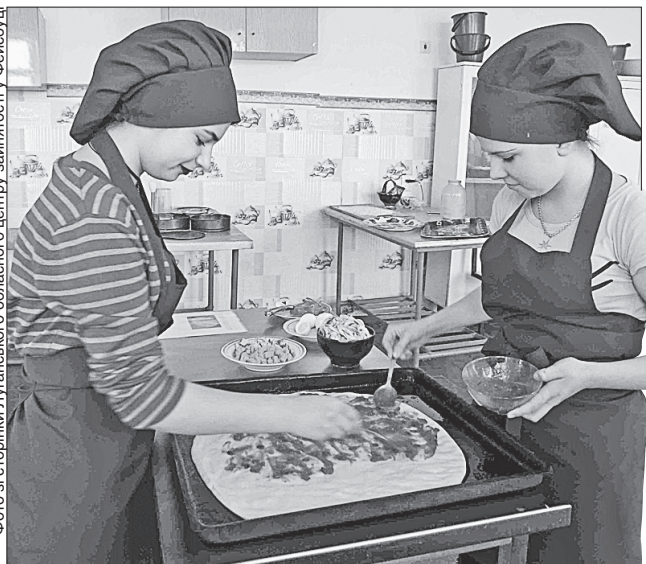
Конкурс професійної майстерності може бути смачним

БРАТИ НАШІ МЕНШІ. Днями рятувальникам Донеччини довелося визволити із слизької крижаної пастки косулю. Пригода сталася на Маячковському водосховищі поблизу Краматорська: один із жителів міста помітив на кризі за 150 метрів від берега тварину, яка, пошкодивши ногу, не могла самостійно перейти водою. Після повідомлення на телефон служби порятунку на місце прибули бійці 12-го Державного пожежно-рятувального загону. Оцінивши ситуацію, вони з допомогою драбини та мотузки змогли дістатися косулі, яка ризикнула вийти на лід без ковзанів, і обережно витягли її на берег. Тепер потерпілому опікуються ветеринари, а після лікування ноги вона зможе повернутися у звичні для неї природні умови життя.