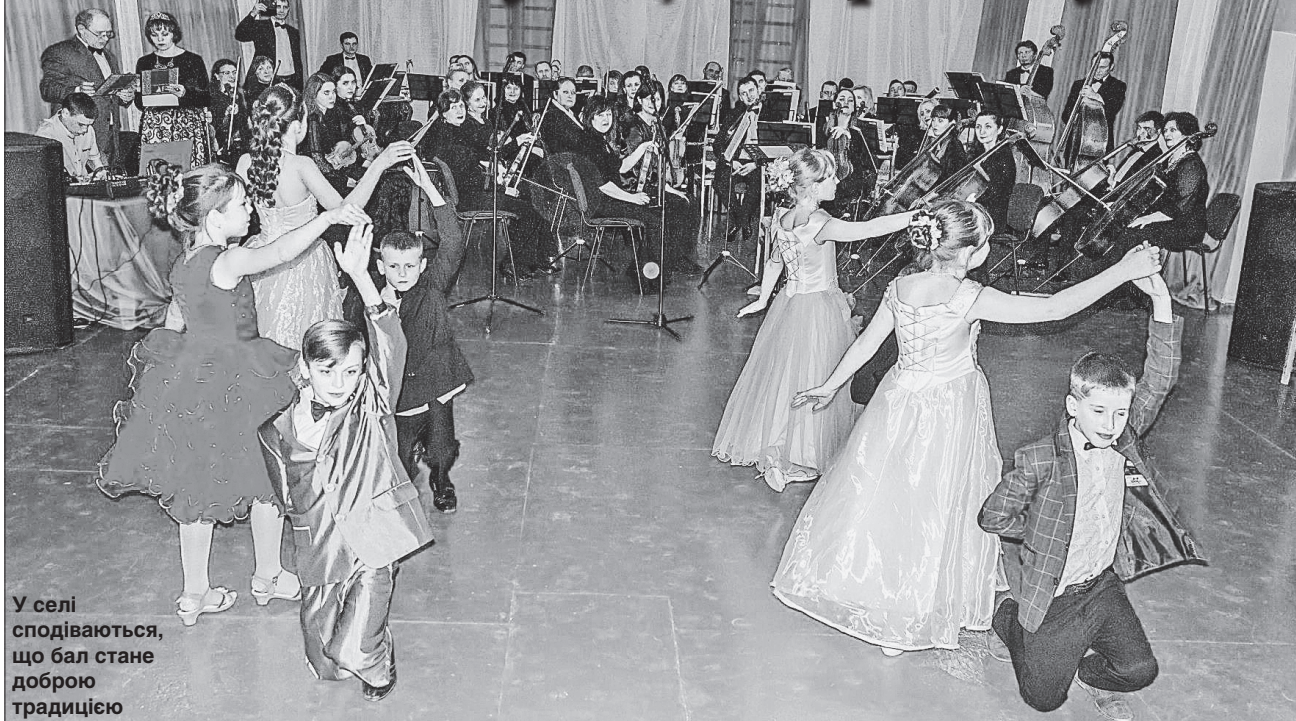
У селі сподіваються, що бал стане доброю традицією