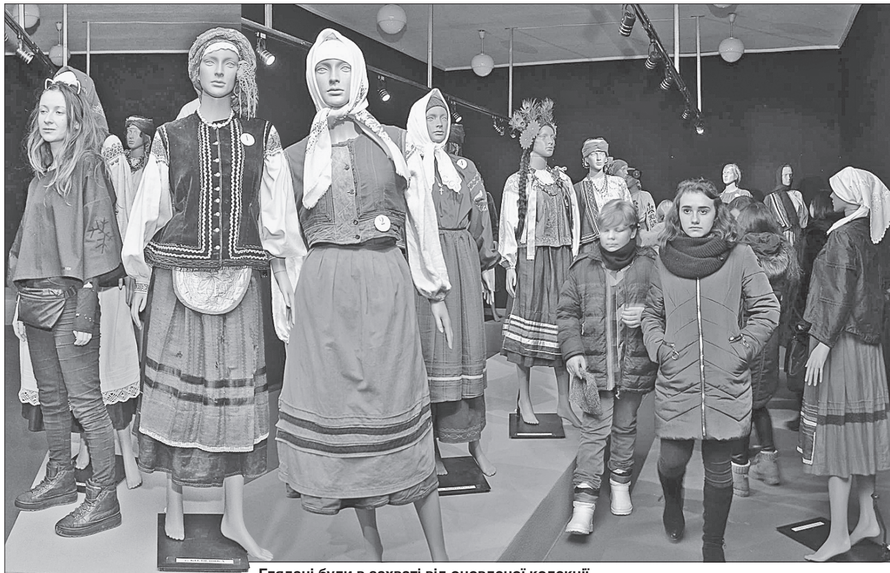
Глядачі були в захваті від оновленої колекції