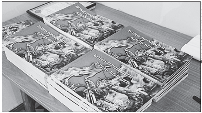
Про випробування афганців нагадає фотоальбом

АЛЬБОМ. У Вінницькому обласному краєзнавчому музеї презентували фотоальбом «Вони пройшли крізь вогонь». Це продовження видання «Незаживаюча рана Афгану», яке з'явилося за сприяння облдержадміністрації та обласної ради, обласного краєзнавчого музею, громадської організації «Асоціація музеїв Вінниччини» та обласної Спільни ветеранів війни в Афганістані (воїнів-інтернаціоналістів). Фотоальбом містить світлин та текстові матеріали про військову службу краян в Афганістані (1979—1989) та миротворчих місія