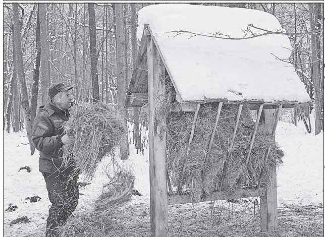
Раціон для звірів розмаїтий