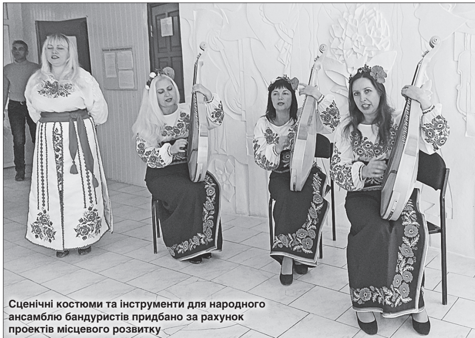
Сценічні костюми та інструменти для народного ансамблю бандуристів придбано за рахунок проектів місцевого розвитку

За її словами, торік на території Біловодської об'єднаної територіальної громади реалізовано 38 проектів, на їх реалізацію було залучено 40,7 мільйона гривень. Проекти профінансовано й за раху-