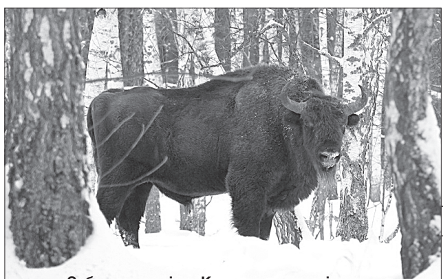
Зубри — гордість Конотопського лісгоспу

Умань наполегливо готується до відвідин гостей. Тут планують розбудувати набережну Осташівського ставу біля комплексу фонтанів «Перлина кохання», а також завершити реконструкцію центральної Соборної площі, яка має стати ще одним привабливим туристським місцем Умані.