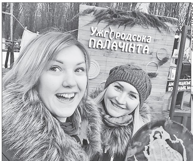
Головний секрет смачних млинців — у доброму настрої

У центрі уваги були млинці, які в Ужгороді звикли називати угорським словом палачината. Ці дуже прості, здавалося б, кулінарні вироби дивували різноманітними рецептами і часто несподіваними начинками — від джемів і меду, грибів і сметани, сиру і м'яса до бананів і ананасів. Володарями титулу переможців із врученням головного призсу «Золотої палачинтовки» (сковорідки) стали кухарі команди «Чаклунка».