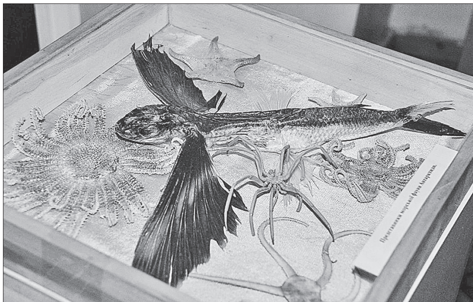
Цей експонат музею цікавить багатьох відвідувачів

А як вона до нього потрапила — також цікаво. Річ у тому, що учасники перших українських експедицій діставалися до Антарктиди не літаком, як нині, а морем. Ось під час переходу через Атлантику на борту науково-дослідницького судна «Ернст Кренкель» дослідник став свідком дивовижного явища — польоту летючих риб у відкритому океані. Одна з таких риб випадково залетіла на палубу судна, і черкашанин залишив собі її як сувенір.