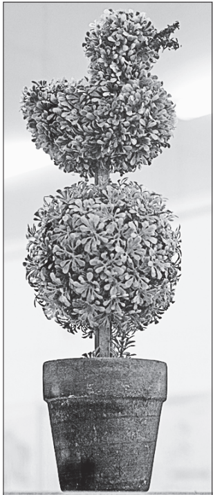
Топіарне мистецтво в облаштуванні зон відпочинку набирає обертів

ДИЗАЙН. «Темниці ландшафтного мистецтва» — так називається виставка, яку експонують у Національному науково-природничому музеї України. Виставковий проєкт представив Національний університет біоресурсів і природокористування, щоб привернути увагу суспільства до дослідження теми молоді. В експозиції представлені унікальні макети і проєкти ландшафтного дизайну