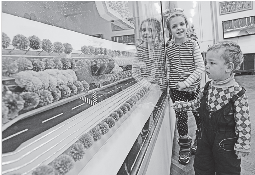
Можливо, в цьому дитячому погляді жевріють дизайнерські рішення