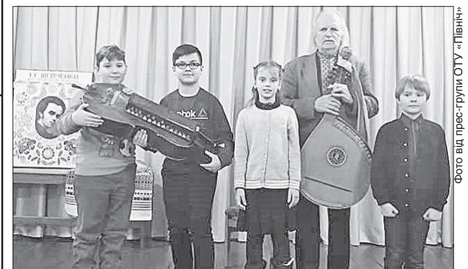
Хлопці й дівчата Луганщини у захваті від виступу народного артиста України Василя Нечепи

МИСТЕЦЬКИЙ ПРОЄКТ. На Луганщину завітали гості з Чернігівської області — активісти, волонтери, керівники і депутати місцевих рад, яких «очолює» відомий у всьому світі кобзар-лірник, лауреат Національної премії імені Тараса Шевченка, народний артист України Василь Нечеп. В межах цієї спільної ініціативи Командування Сухопутних військ ЗС України та органів місцевого самоврядування Чернігівщини відбулися численні концерти Василя Нечепи у Северодонецьку, Лисичанську, Новодружеську. На кожному концерті — аншлаґ і глядацький успіх. А творчому колективу Северодонецького коледжу культури і мистецтв імені Сергія Прокоф'єва делегація з Чернігівщини ще й зробила безцінний подарунок — справжню бандуру.