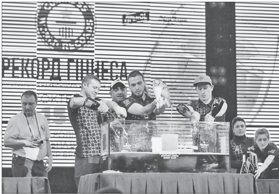
Гостей пригощали рекордним коктейлем

РЕКОРДНИЙ НАПІЙ. У своє професійне свято львівські бармени вирішили встановити новий всеукраїнський рекорд, приготувавши найбільший у країні коктейль. Досі такий показник становив 105 літрів мохіто. Цього тижня, щоб зафіксувати новий результат, бармени зібралися в місті Лева і приготували 150 літрів коктейлю aperol spritz. Для цього використали понад 100 літрів різних напоїв. А щоб коктейль смакував із прохолодою, до нього додали 40 кілограмів льоду. Прогустувати напій могли безплатно всі охочі. Крім встановлення національного рекорду, відбулася й битва барменів бариста-шоу. Організували і церемонію нагородження найкращих львівських барменів.