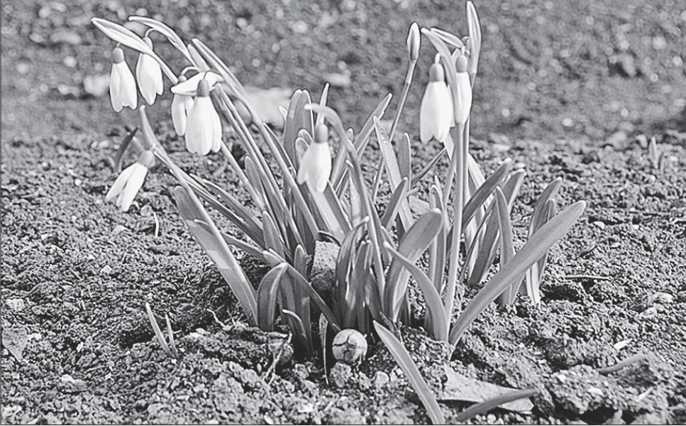
Передвісники весни квітнуть на великих ділянках заповідника