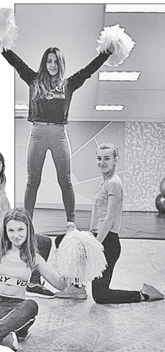
Дівчатка вже вивчили запальні номери для майбутніх виступів

Коли тренування дівчаток, які захоплюються чирлідінгом, побачив голова Біловодської об'єднаної територіальної громади Едуард Олейніков, то пообіцяв, що спортсменок із села Євсуг запрошуватимуть на всі місцеві волейбольні змагання. Але для участі в таких заходах дівчаткам потрібні красиві костюми. Отже, громадські активісти вже пишуть новий проект. І впевнені в перемозі.