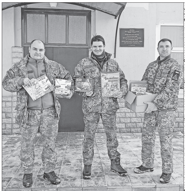
Військові кажуть, що приємно приносити людям подарунки, які викликають позитивні емоції, усмішки і радість