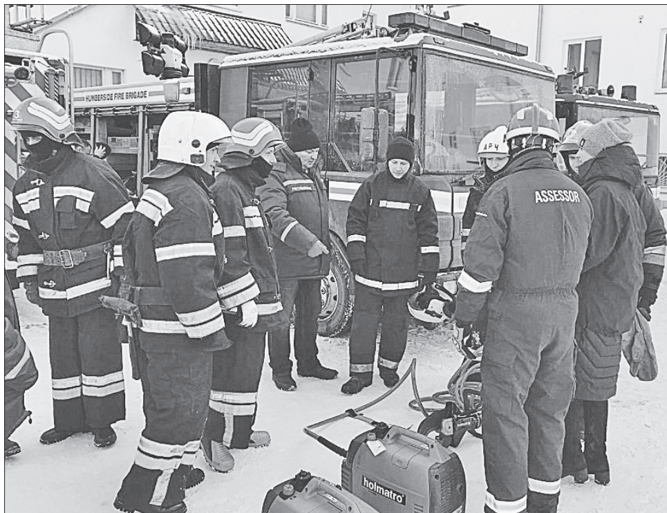
Нове обладнання допоможе полтавським пожежникам у їхній нелегкій роботі

Крім шотландців, у Полтаву приїхало п'ятеро представників рятувальної організації Великої Британії UKRO, що привезли кілька наборів рятувальних інструментів, якими розрізають метал у понівечених авто, щоб звільнити людей. Британські й полтавські