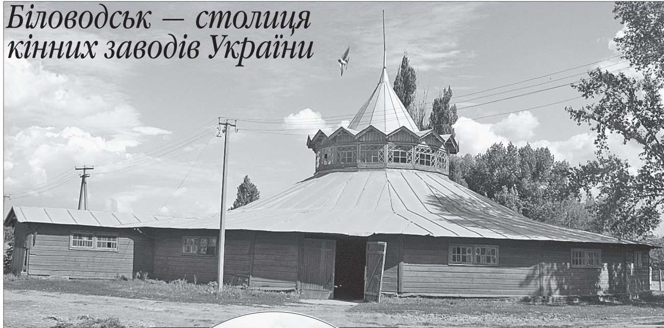
Іванка МІЩЕНКО для «Урядового кур'єра»