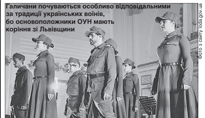
Галичани почуваться особливо відповідальними за традиції українських воїнів, бо основоположники ОУН мають коріння зі Львівщини

Під час урочистостей музичні твори запропонувала державна заслужена хорова капела України «Трембіга» й інші виконавці. Ювілею ОУН в області присвятили флешмоб «Слова незламних». У сесійних залах органів місцевого самоврядування учні загальноосвітніх навчальних закладів, студенти й активна молодь читували відомих діячів ОУН. Опісля заспівали гімн Організації українських націоналістів «Зродились ми великої години». Тим часом Державний архів Львівської області підготував онлайн-виставку документів, що зберігаються тут. Основу експозиції, за інформацією прес-служби облдержадміністрації, становлять відозви «До українського народу» та Декларація проводу Організації українських націоналістів за 1945 рік, де сформульовано основні засади діяльності ОУН. Представили світліни, на яких зображено членів ОУН, подбали й про короткі біографічні довідки до них.