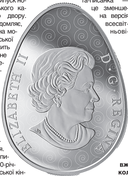
Нова срібна монета — вже четверта у «писанковій» колекції канадських монет

ється за напрямком вітру. Величезний відсоток населення Вегревіля має українську спадщину, а Вегревільська писанка друка за величиною у світі.