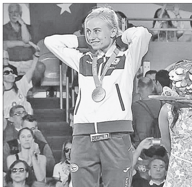
Стипендіатка Президента, дворазова бронзова призерка Паралімпійських ігор, володарка кубка світу із дзюдо Юлія Галінська важить лише 48 кілограмів

Рівненський «Інваспорт» має постійну підтримку від обласної влади, і не лише в поліпшенні матеріальної бази. Приміром, торік суттєво збільшили суму винагороди, яку отримують спортсмени з обласного бюджету за перемоги на офіційних міжнародних змаганнях. Бо для іміджу держави ці надзвичайно сильні духом люди роблять неоціненне.