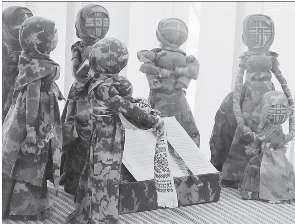
Ляльки-мотанки у камуфляжі — своєрідний оберіг наших захисників