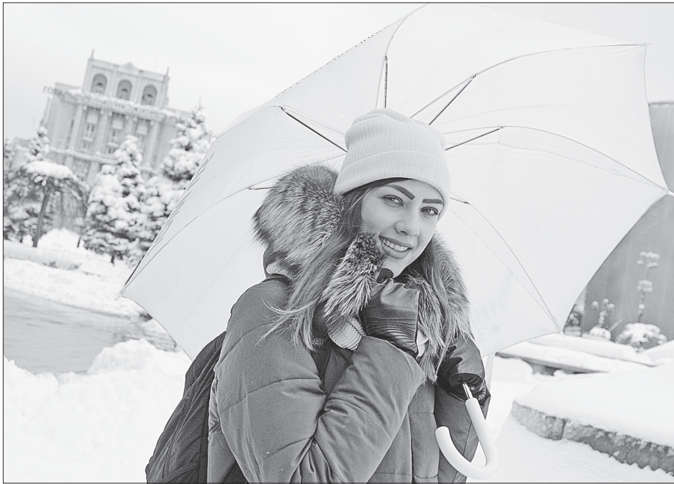
Попри мороз чи дощ дихання весни відчувається