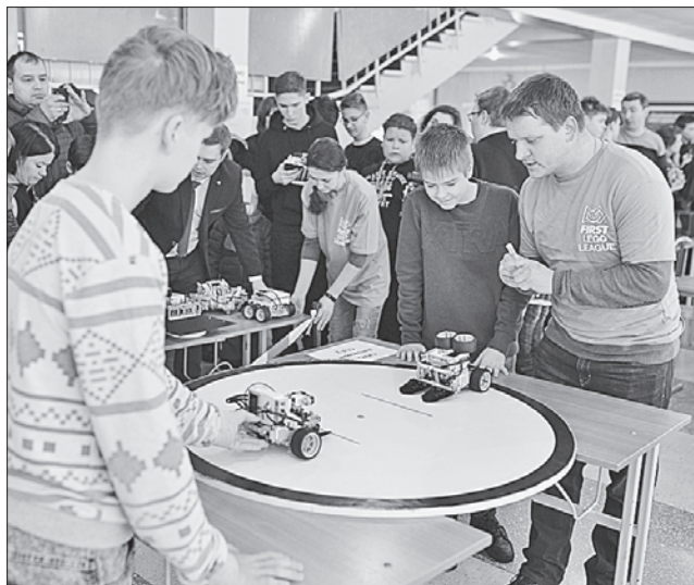
Розробки школярів були цікаві і для дорослих

З РОБОТОТЕХНІКОЮ НА ТИ. Уже втретє Черкаси стають майданчиком для інноваційних змагань серед школярів. Понад 500 учасників, 128 команд із Черкащини, Миколаївщини та Києва зібрали цими днями регіональний фестиваль з робототехніки FIRST LEGO League. Участь у таких змаганнях — визначальний крок для молоді у майбутнє. Цьогоріч до заходу долучилися діти з особливими потребами. Нині на Черкащині 30 шкіл мають набори LEGO. Навчаючись у таких школах, діти в подальшому більше цікавляться конструюванням, математи-