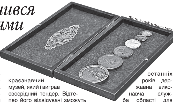
останніх років державна вкопана служба області для поповнення фондів закладу передала 830 унікальних предметів, які зайняли місце в експозиції.

через державний кордон у вагоні пасажирського потяга. За повідомленням ГУ юстиції в Сумській області, тоді монети описали, заарештували, оцінили і передали на реалізацію. Після двох оцінок їх не реалізували, тож відповідна комісія вирішила передати монети безплатно. Серед тих, хто подав заявки на одержання нумізматичних цінностей, був Сумський обласний