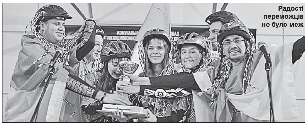
Радості переможців не було меж