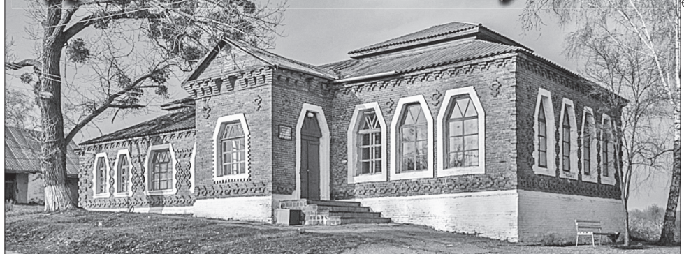
Школа в селі Риги Лохвицького району вражає цегляним оздобленням у вигляді полтавської мережки з альбомів Олени Пчілки

Олександр ДАНИЛЕЦЬ, «Урядовий кур'єр» ВІДНОВЛЕННЯ ІСТОРИЧНИХ БУДІВЕЛЬ. У Лохвицькому районі Полтавської області планують відновити будівлі земських шкіл, споруджених на початку минулого століття за проектом архітектора Опанаса Сластіона. Ці будівлі визнано пам'ятками культурної спадщини місцевого значення. Шкіл Лохвицького земства, зведених у стилі українського архітектурного модерну, збереглося майже пісотно — в Лубенському, Лохвицькому, Пирятинському й Чорнухинському районах на Полтавщині. А також у Варвинському Чернігівській та Роменському Сум-