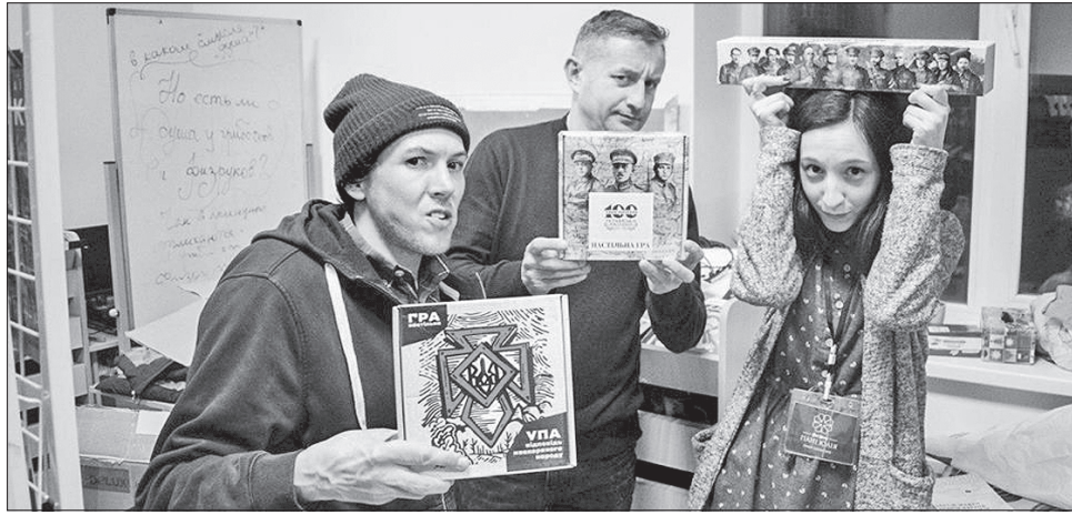
На Луганщині розпочався проект «Схід читає»

Завдяки проекту «Схід читає» бібліотеки постійно отримують