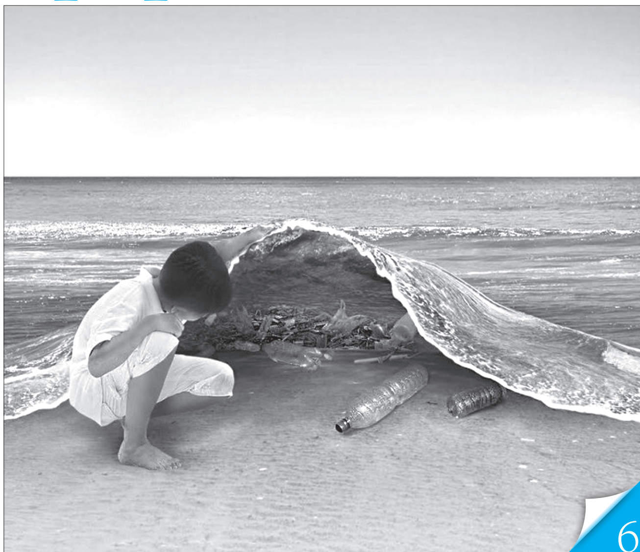
Колаж із сайту facebook.com/FoodBioPackUA