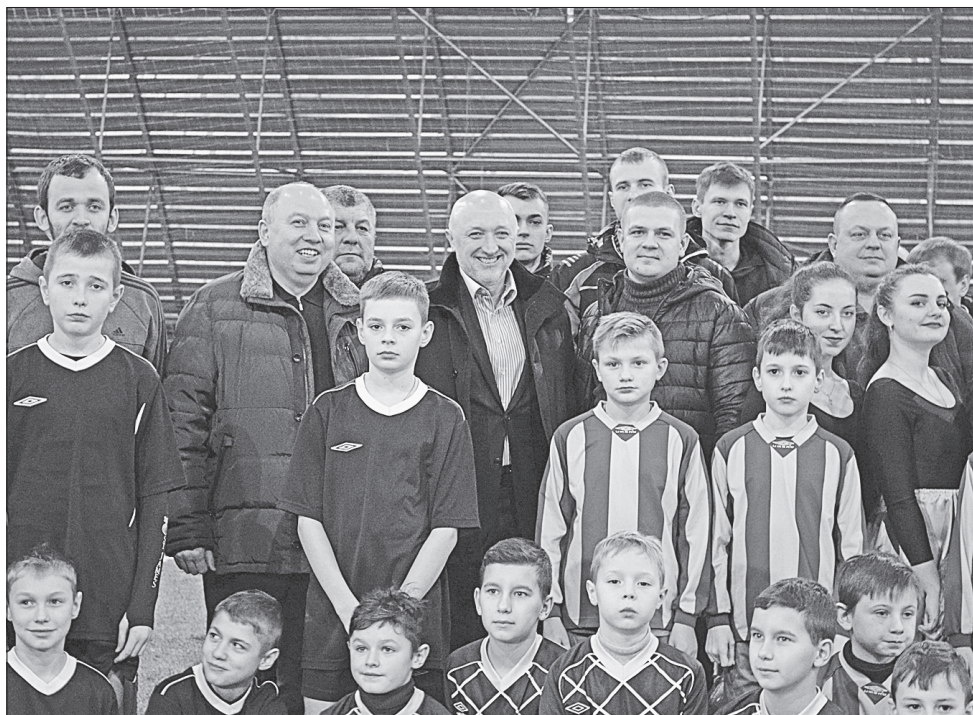
Голова Полтавської ОДА Валерій Головка (у центрі) з юними спортсменами на відкритті оновленого спорткомплексу «Розсошенці»

У Полтавському районі останнім часом розвитку спорту приділяють значну увагу. А події у Щербанях передували відкриттю відремонтованих спортивних залів у селах Черноглазівка й Тахтаулове.