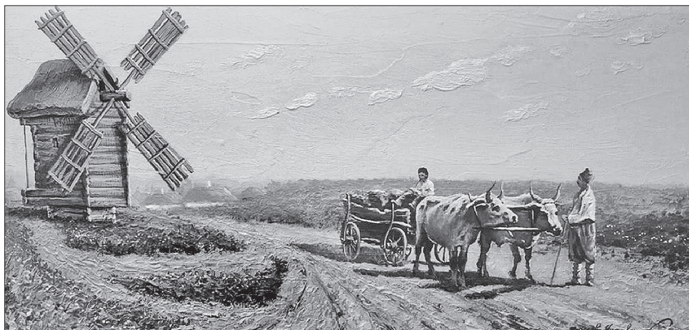
Картина Ярослава Чижевського «Чумацький шлях» відтворює південні степові пейзажі України

Кожен із партнерів представлятиме власні atrakції. Асканія-Нова запросить гостей на заповідні землі й ознайомить з екзотичними тваринами, а в Присіваській ОТГ туристів приваблюватимуть унікальним Лемурийським озером. Тавричанська