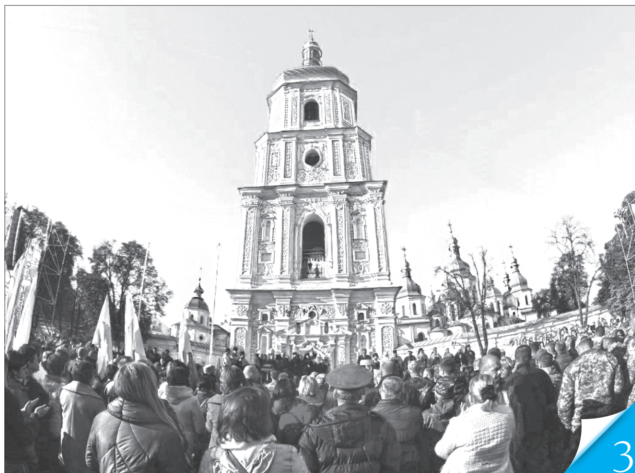
На цій історичній площі відновлювали єдність нашого народу, що існувала за Володимира Великого та Ярослава Мудрого, до якої прагнули наші великі гетьмани Богдан Хмельницький, Петро Дорошенко та Іван Мазепа

АКТ ЗЛУКИ. Об'єднання УНР і ЗУНР показало можливість цивілізованого демократичного неекспансійного неімперського збирання територій в єдиній суверенній державі