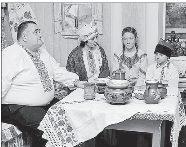
Учасниками святкування були й самодіяльні актори, і відвідувачі

Як повідомляє управління культури, національностей та релігій Луганської ОДА, етнографічна виставка триватиме до кінця січня, тож музей запрошує всіх охочих.