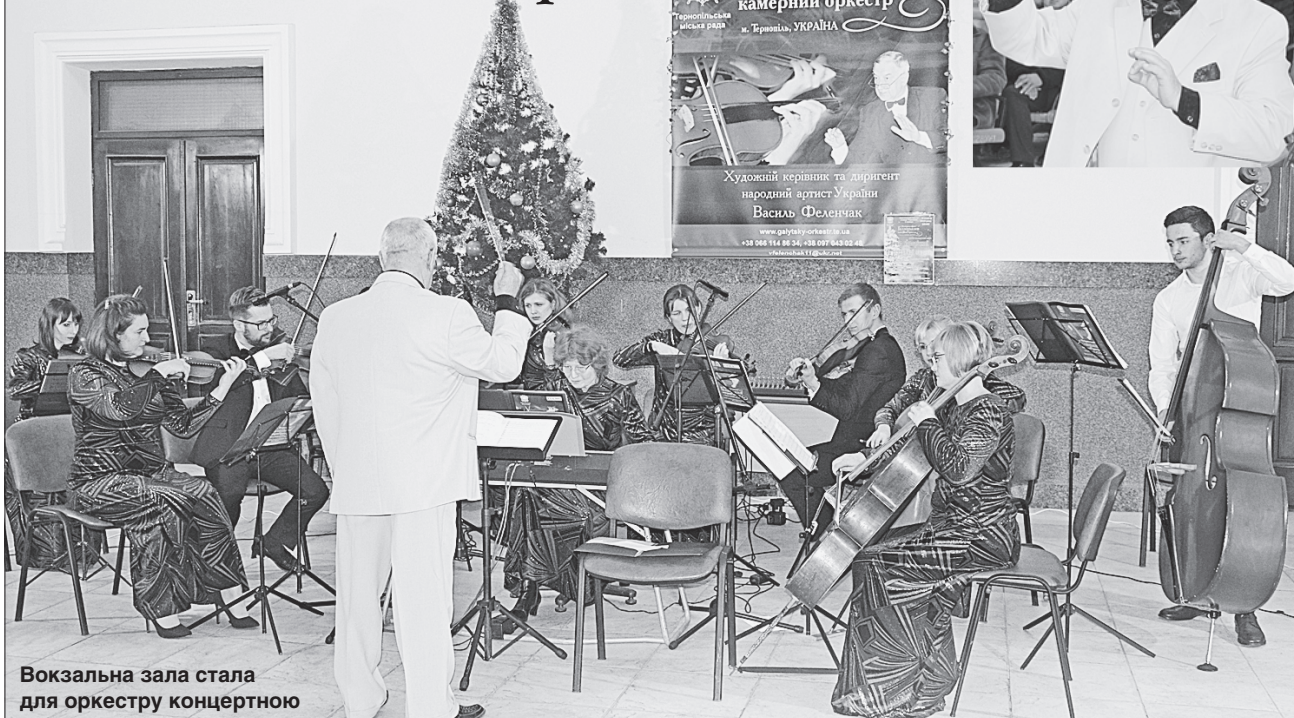
Вокзальна зала стала для оркестру концертною

Микола ШОТ, «Урядовий кур'єр» (фото автора)