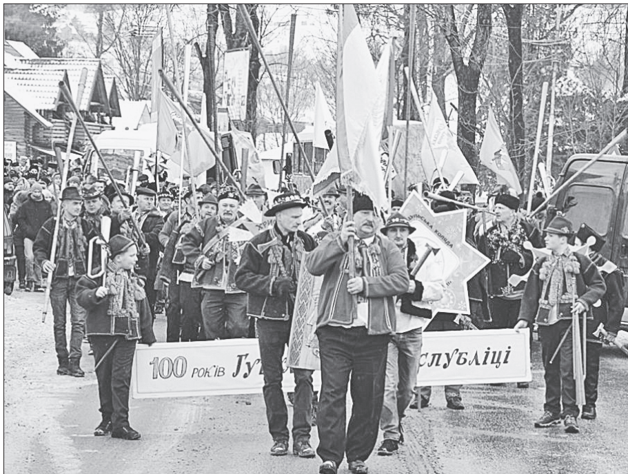
Народне віче в Ясіні було урочистим і багатолюдним

На стадіоні відбувся щорічний фестиваль «Велика гуцульська коляда». Учасники з різних куточків Рахівщини, а також із сусіднього Прикарпаття показали традиції колядок, наповнених місцевим колоритом.