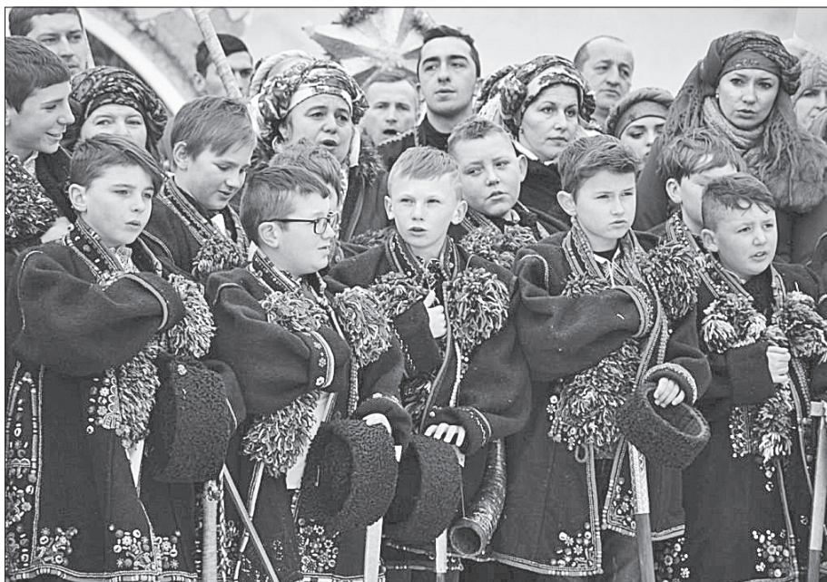
Гімн України для кожного закарпатця наповнений особливим змістом