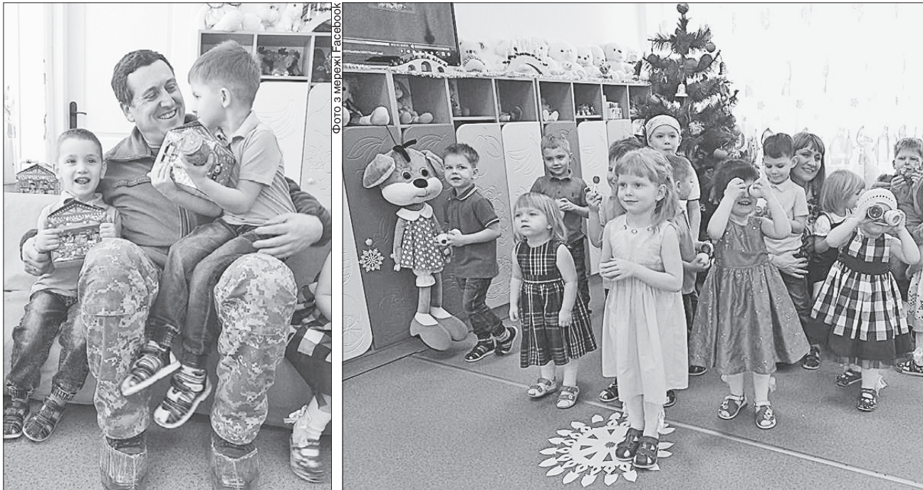
Офіцери ЦВС спільно з представниками громадської організації «Волонтерський рух «Батальйон Сітка» відвідали Луганський обласний будинок дитини №2, який нині в Северодонецьку

ДИВА ЗБУВАЮТЬСЯ. У новорічні свята в дива вірять навіть дорослі. Що вже казати про дітей, особливо тих, на дитинство яких припали тяжкі випробування. Саме вони найбільше потребують нашої уваги і віри у все добре і прекрасне. Гарним приводом скористалися офіцери цивільно-військового співробітництва зі складу операції Об'єднаних сил і завітали до Луганського обласного будинку дитини в місті Северодонецьку. «Діди Морози» у військовій формі принесли вихованцям солодощі й пода-