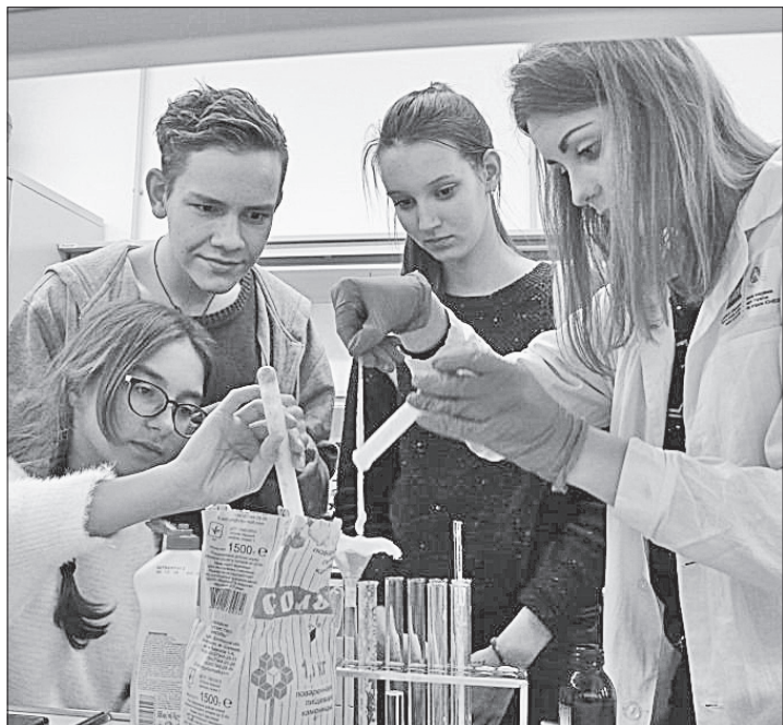
Діти кажуть, що це була чудова яскрава подорож