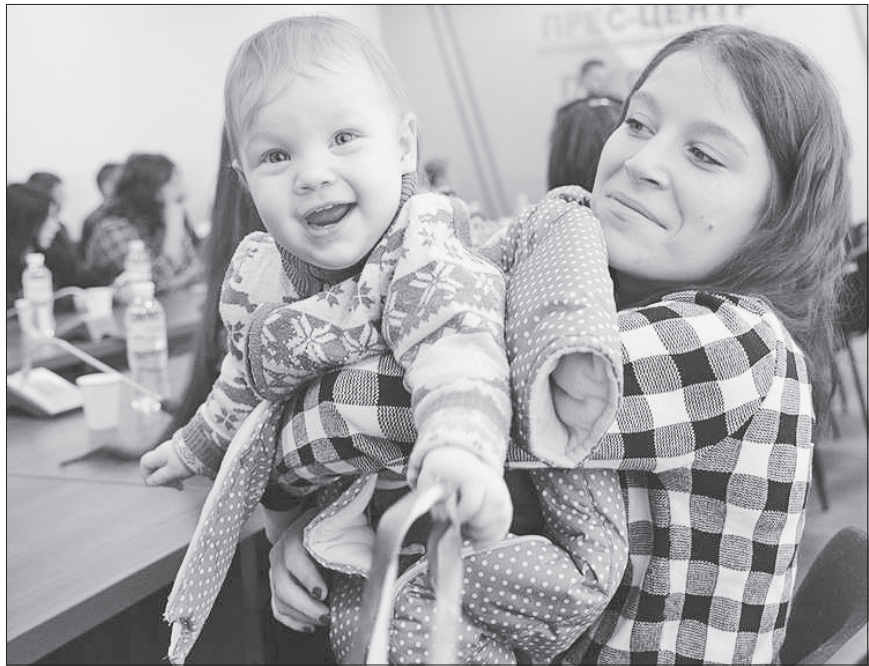
Про новий дім мріяли навіть маленькі