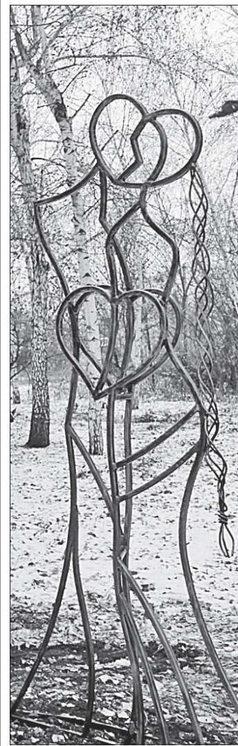
Силует закоханої пари створює романтичний настрій

Під час урочистого відкриття оновленого скверу місцеві жителі говорили про те, що «це місце було забуте, та нарешті навели тут лад, поставили гарні ліхтарі, і стало дуже заатишно», дякували, але казали, що «гарно було б, аби у цьому сквері розташували ще й дитячий майданчик». Далі буде, стверджують активісти. Навесні тут планують встановити кований міст для закоханих, а також висадити 20 кущів троянд. І для цього попаснянці вже написали й виграла грантовий проект, який фінансує Фонд «Східна Європа» в партнерстві з німецькою громадською організацією.