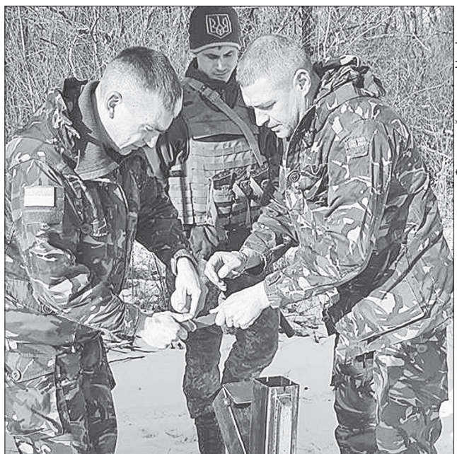
Бійці без проблем змонтували диво-пічку