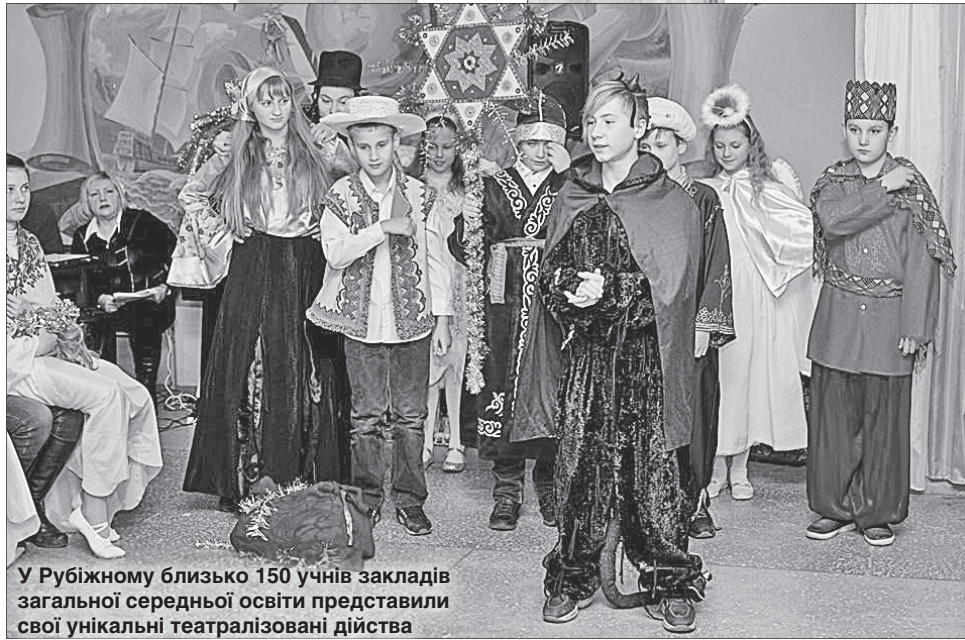
У Рубіжному близько 150 учнів закладів загальної середньої освіти представили свої унікальні театралізовані дійства