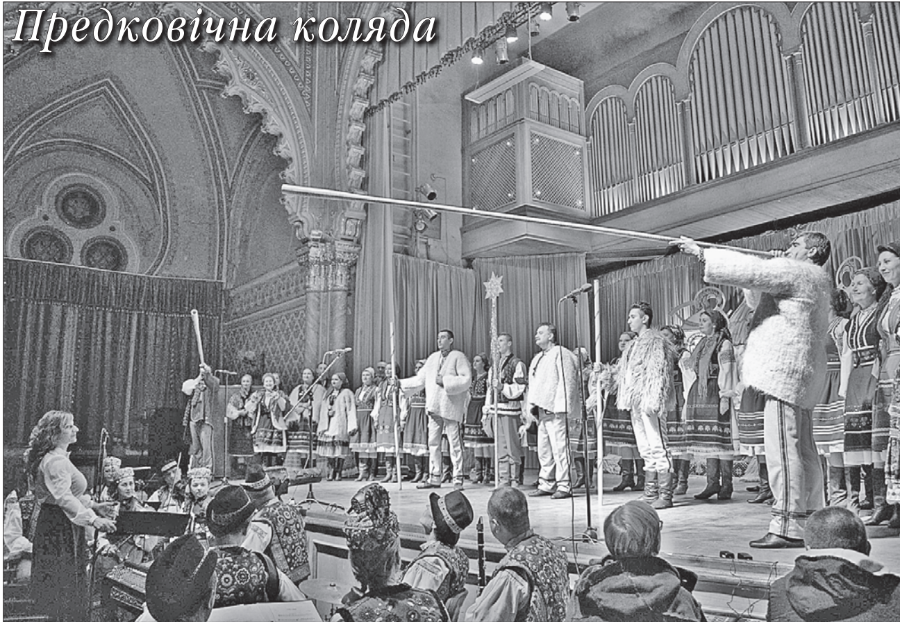
Незвичний концерт «Легенди Різдва» проходив під супровід трембіт