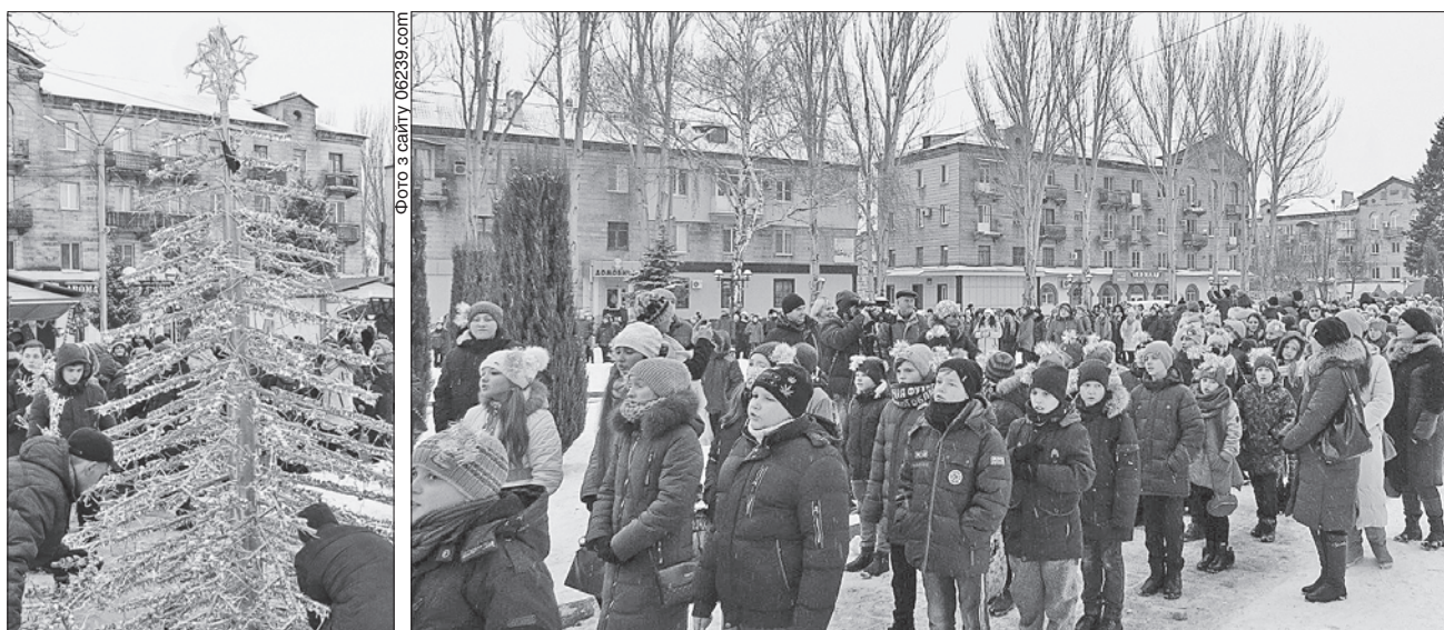
На ялинці — 5 тисяч дзвоників

А по-друге, на площі в Покровську спільними зусиллями дітей зібрали дуже колоритну новорічну ялинку, на якій розвісили 5 тисяч маленьких дзвоників. Їх символічний передзвін також нагадав про улюблені свята дорослим і малечі.